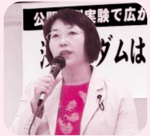
「学習交流集会以この間の浅川ダムに関する情勢を報告する(9月27日)」