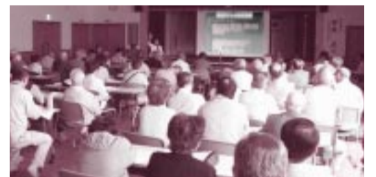
学習交流会で荒砥沢ダム現地視察の報告をする石坂ちは県議