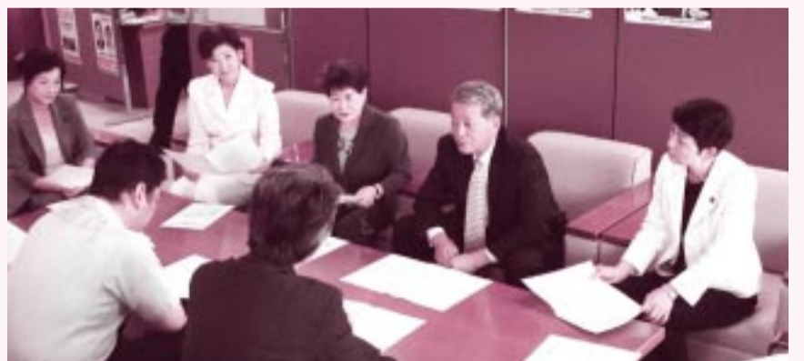
県立病院の独立行政法人化問題で、県職労が要請に来室（9月24日）

勝山病院事業局長は「独法化は重要な選択肢の一つ、22年4月は目標時期」としましたが、知事は「可及的速やかに独法化して再構築する」と答弁しました。